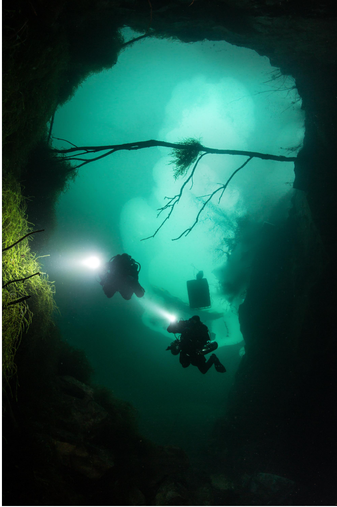
Montolan eteläpää